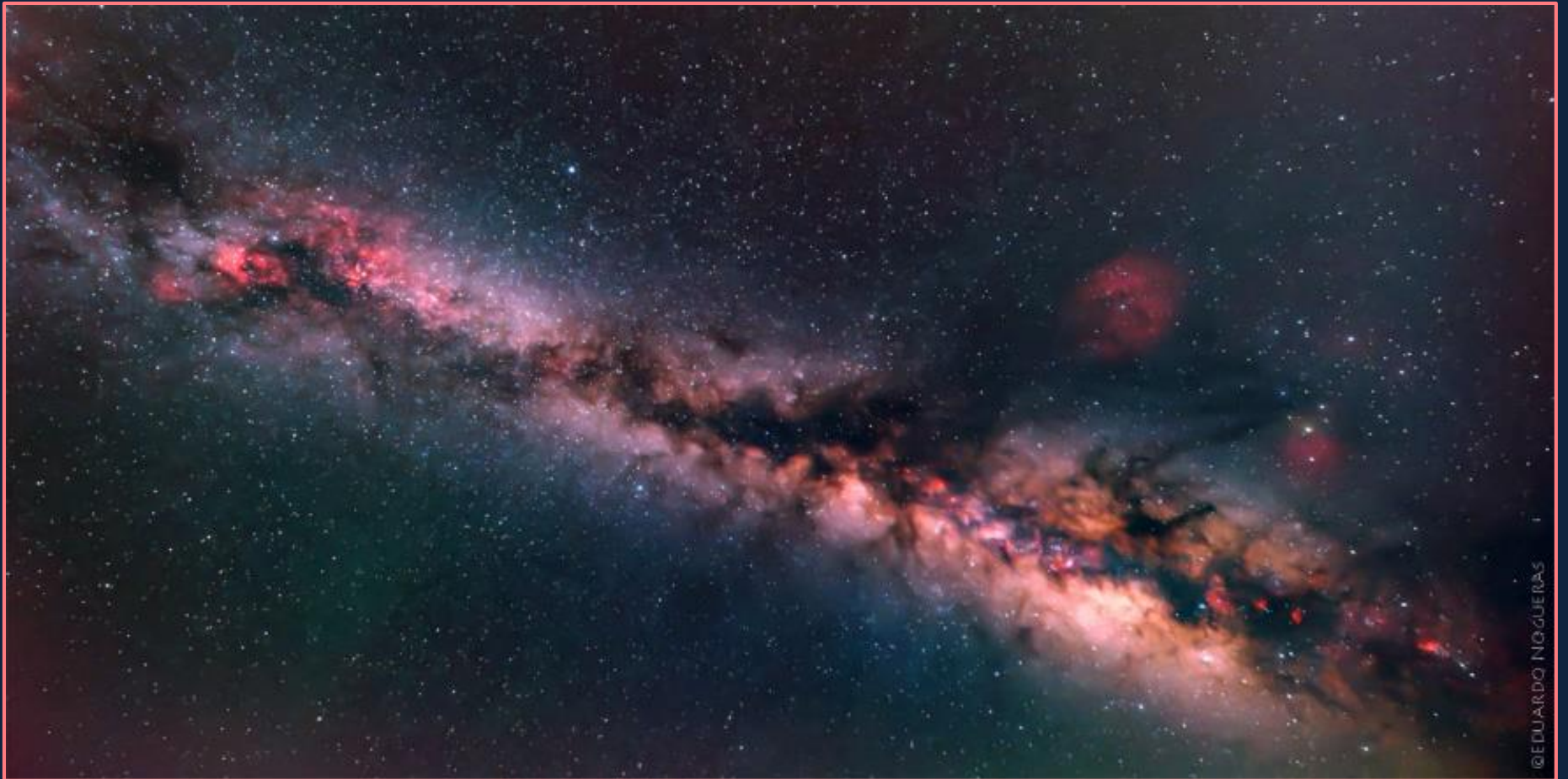
Panorámica de las nebulosas más brillantes de la Vía Láctea en el cielo de Verano

EN VERANO VEMOS LA ZONA DE SAGITARIO EN LA VÍA LÁCTEA