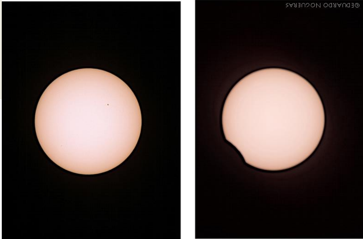
El Sol queda parcialmente oscurecido por la Luna a pleno día

UN ECLIPSE PARCIAL DE SOL ACONTECE SOBRE EL CIELO DE GRANADA