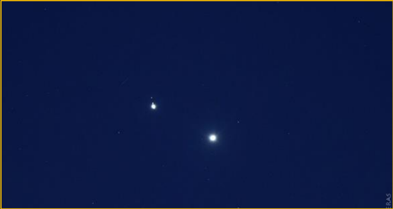
Los planetas brillando cerca del horizonte sobre los cielos del PN Sierra de Huator

LOS PLANETAS JÚPITER Y VENUS SE DEJAN VER MUY JUNTOS AL ATARDECER