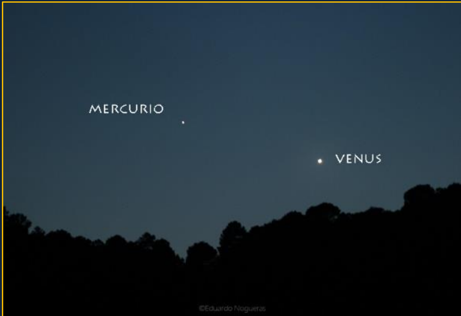
Los planetas brillando cerca del horizonte sobre los cielos del PN Sierra de Huetor

LOS PLANETAS VENUS Y MERCURIO SE APROXIMAN AL ATARDECER