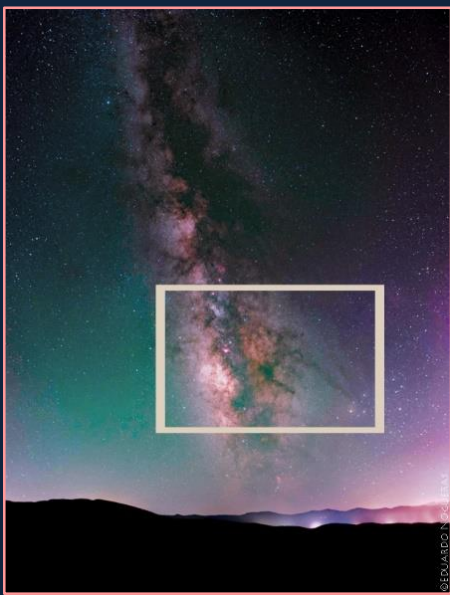
Zona donde se localiza el centro de la Vía Láctea

Esta zona del cielo se suele ver desde el mes de marzo a septiembre en el hemisferio norte en dirección Sur, cerca del horizonte.