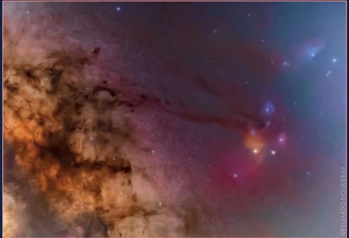
Panorámica de la zona central de la Vía Láctea