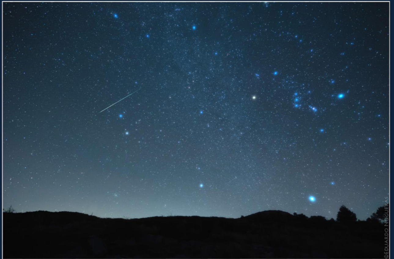
Un meteoro cruza el cielo dejando una estela luminosa durante las Gemínidas