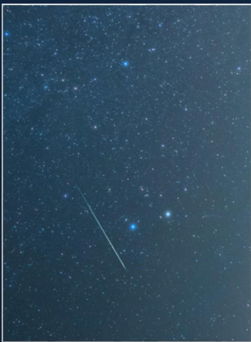
Una gemínida cruza el cielo de la Sierra de Baza.

Se programó la cámara para capturar fotografías durante 3 horas.