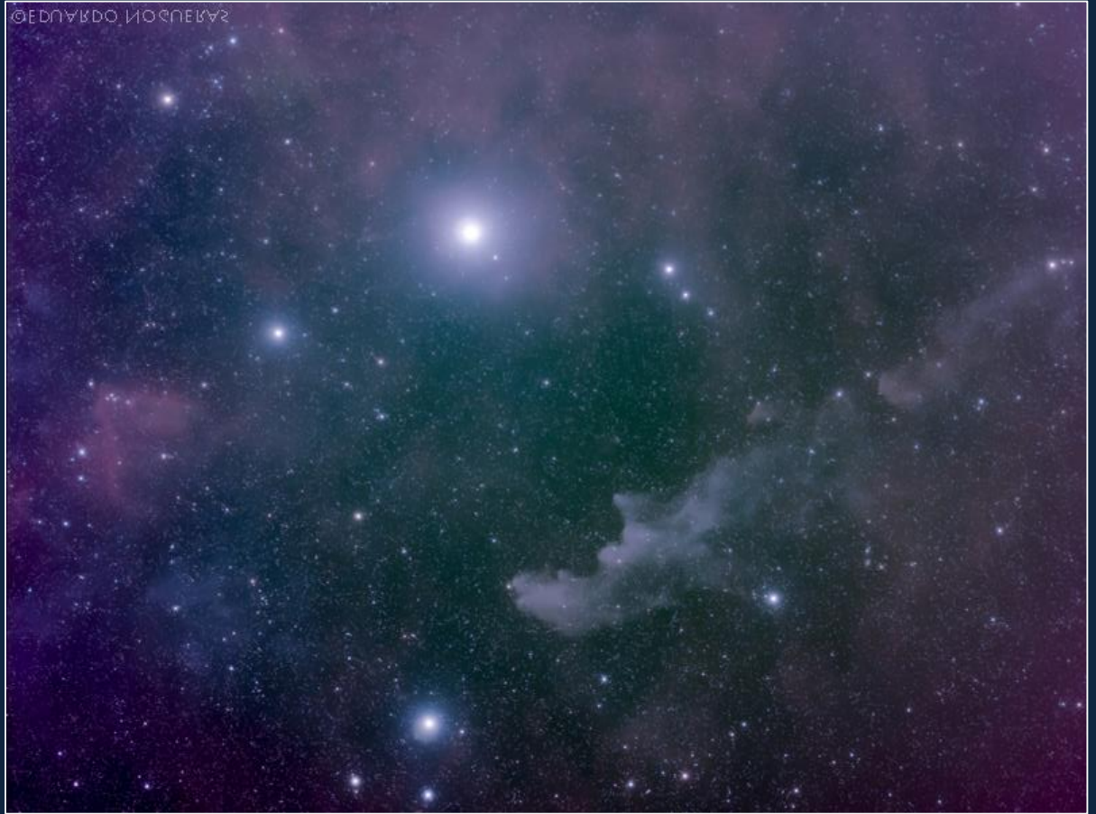
Nebulosa Cabeza de la bruja fotografiada con telescopio

Para localizarla dirigí la mirada hacia la constelación de Orión y una vez localizada la estrella Rigel, la más brillante de Orión, dediqué unos minutos a buscar el encuadre más adecuado. La cámara réflex estuvo realizando fotografías de 2 minutos durante tres horas con el 135 mm en modo DX, por lo que la distancia focal efectiva eran 202 mm.